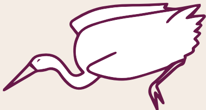
Tjulpungka kutjupara kanyilpai munu ungkupai